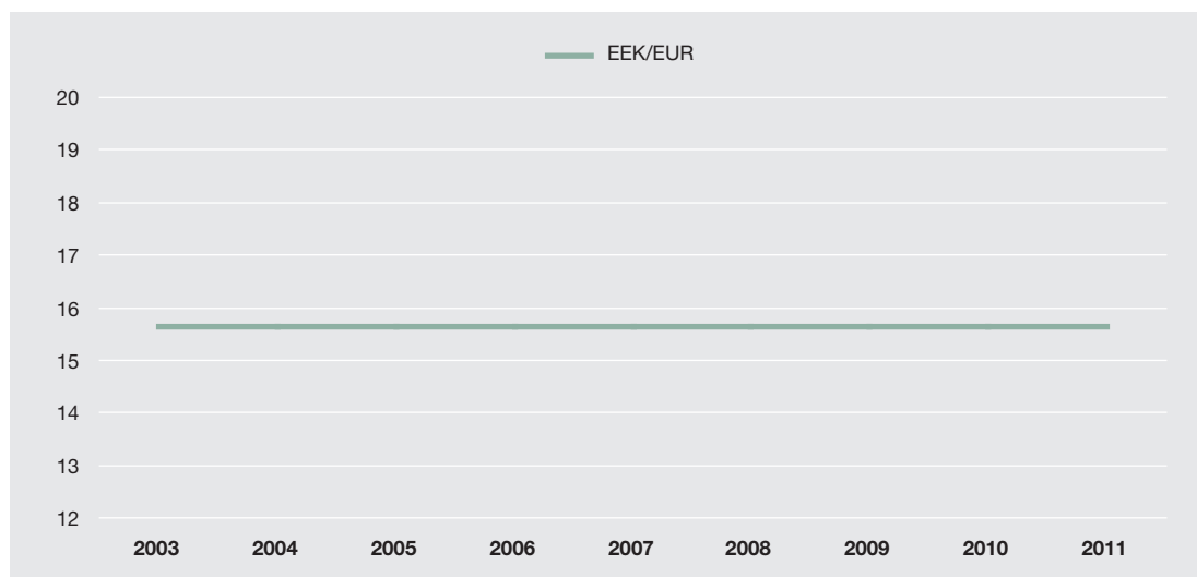
Joonis 2. Eesti krooni vahetuskurs euro suhtes

Eesti valuutakomitee tõrgeteta toimimine 1992. aastast on meie majanduse konkurentsivõime ja