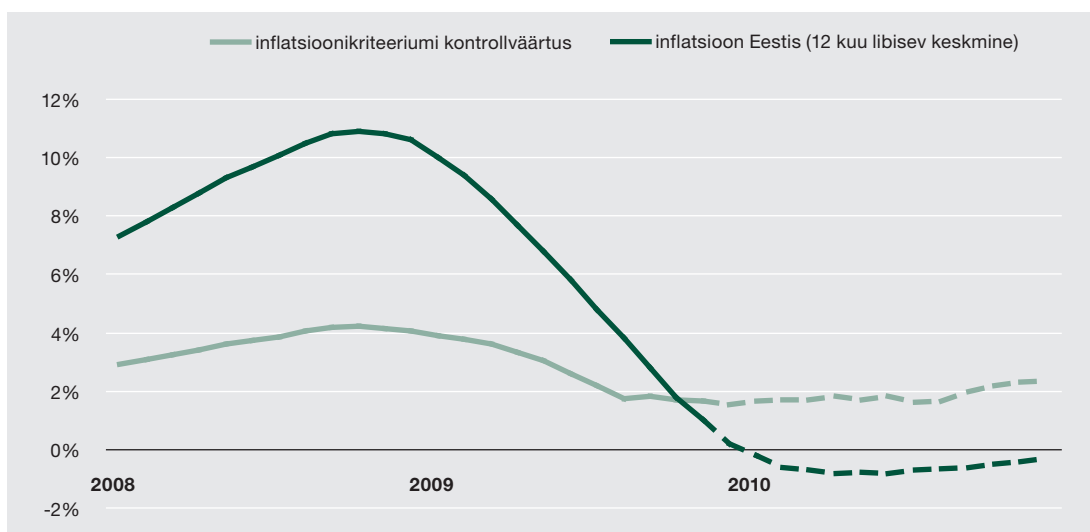
Joonis 1. Inflatsioonikriteeriumi täitmine

Eesti Panga sügise majandusprognoosi järgi alaneb hinnatase Eestis käesoleva aasta lõpul ja järgmise aasta esimesel poolel veelgi. 2009. aasta keskmiseks hinnatõusuks prognoosib Eesti Pank 0,1% ning 2010. aastal 0,4% langust. Kuigi inflatsioonikriteeriumi täitmise hindamisel kasutatav 12 kuu keskmine inflatsioon alaneb mõnevõrra aeglasemalt, täitis Eesti Maastrichti inflatsioonikriteeriumi juba 2009. aasta novembris (vt joonis 1).