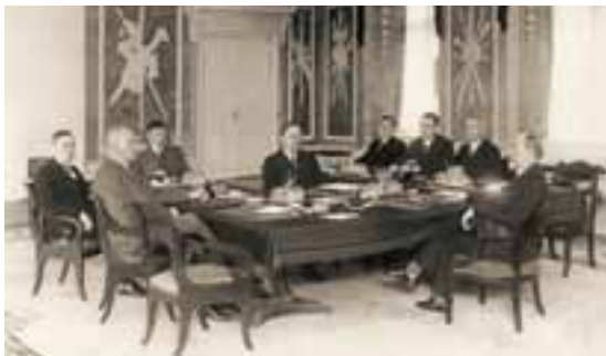
1933. aasta kevadel tuli võimule Jaan Tõnissoni valitsus.